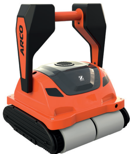
Robotický vysavač ARCO