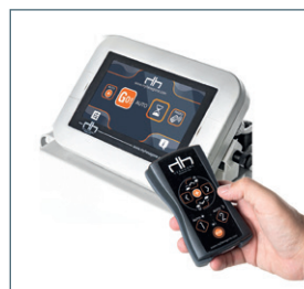
Dotykový displej Touch screen