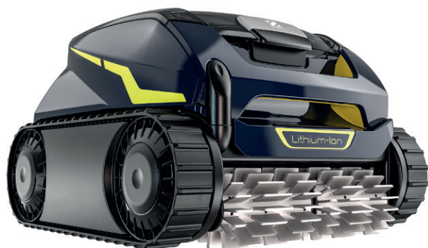
RF 5400 – FreeRider