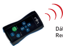
Dálkové ovládání pro všechny roboty Chrono MP3 Remote control for all CHRONO MP3