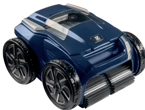
RA 6500iQ RA 6800iQ RA 6900iQ