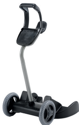
Transportní vozík Trolley