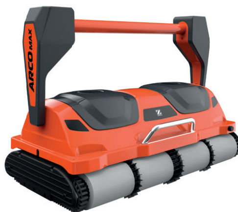
Robotický vysavač ARCO MAX