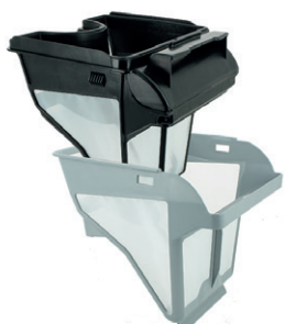
Duální filtrační schopnost Dual filter canister (150/60 μ)