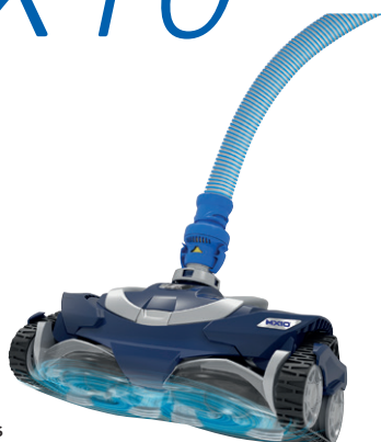
2 lopatková kola s kartáči 2 blade wheels with brushes