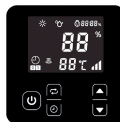
LED Touchscreen Dodirni LED zaslon