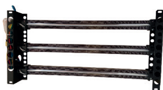
Zusatzheizung (optional) Dodatni modul grijanja

* DER – Energetska učinkovitost odvlaživanja