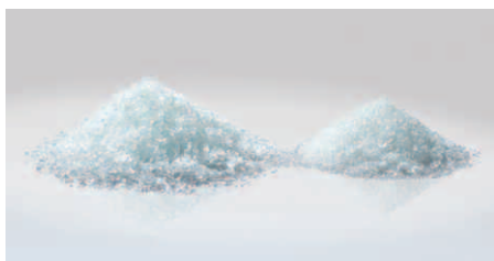
Filtrační sklo Crystal Clear