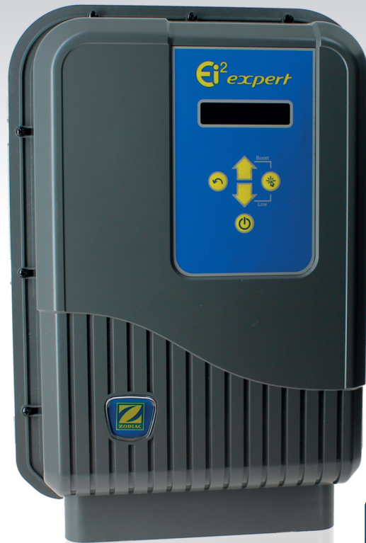
Ei 2 Expert