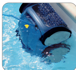
Rychle se otáčející kartáče