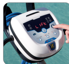
Programování 7 dní v týdnu (RV5400 a RV5500)