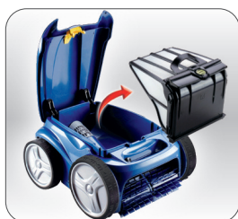
Hygienický filtrační koš, který snadno vyprázdníte