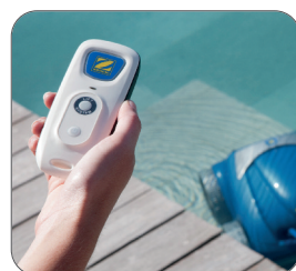
Ovládání robota nakláněním ovladače (4 směry) (RV4550 a RV5500)